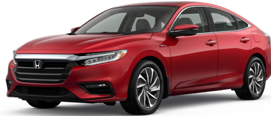
Rouge rayonnant métallisé