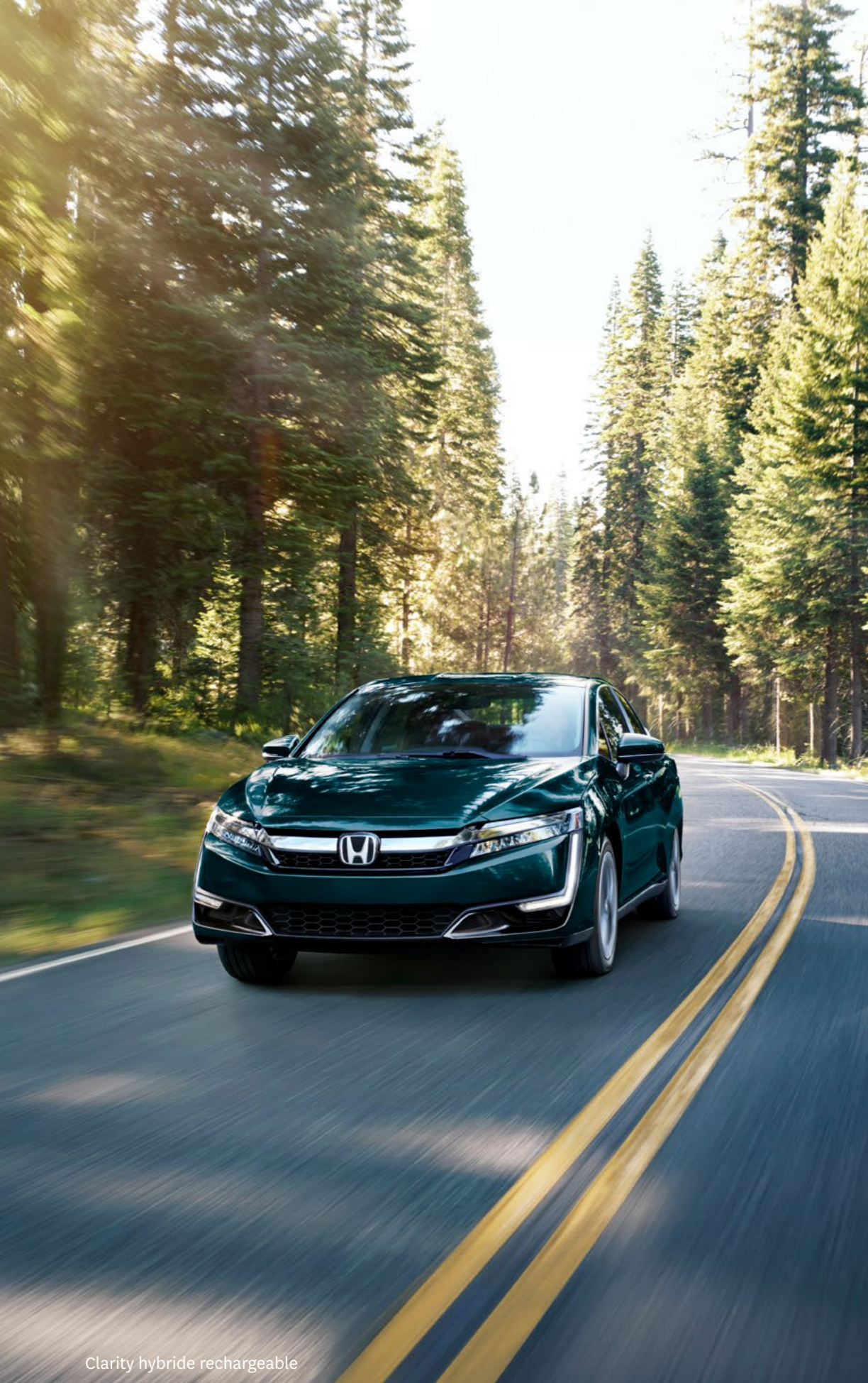
Clarity hybride rechargeable