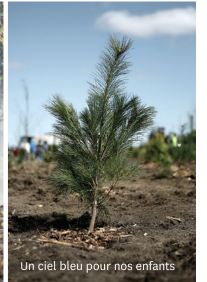
Un ciel bleu pour nos enfants