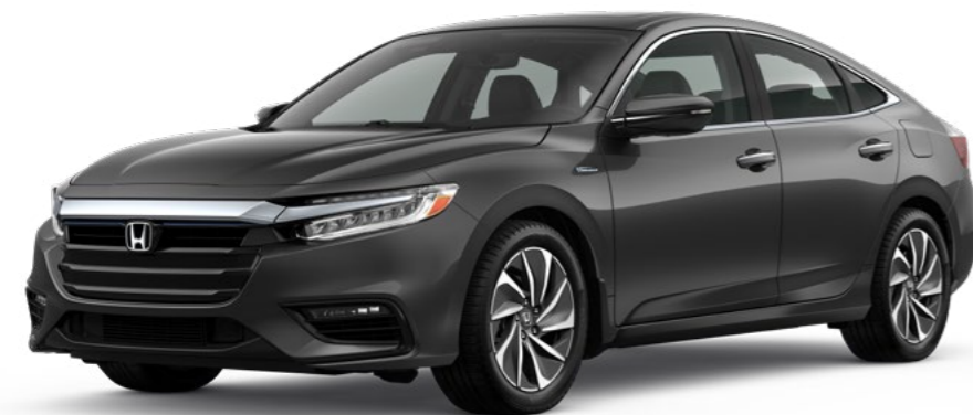
Acier moderne fini métallisé