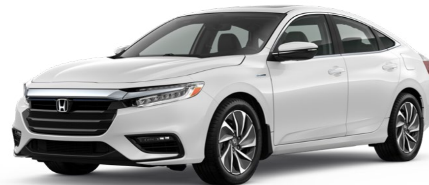
Blanc platine nacré